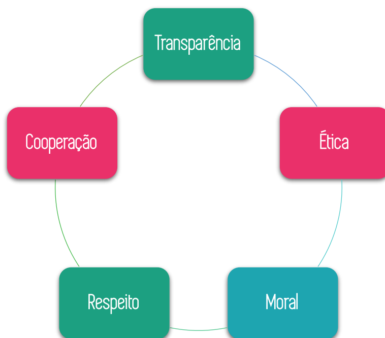
Figura 1 - Valores da Associação World Needs